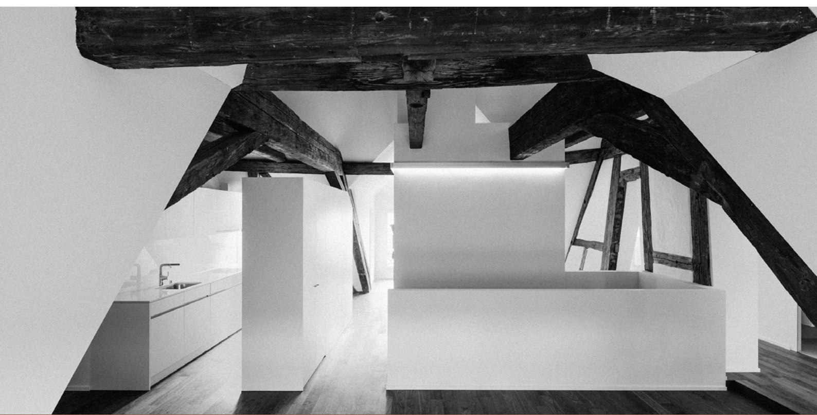
Umbau Altsadthäuser Neugasse 10-12 Zug

Weit mehr als Architektur. Unsere Dienstleistungen umfassen Neubauten, Umbauten, Renovationen, Instandhaltung mittels Studien, Bebauungskonzepte, Städtebau, Projektentwicklung, Architektur, Ausführungsplanung, Bauleitung, Projektmanagement, Bauherrenberatungen, Generalplanermamente, General- und Totalunternehmerleistungen.